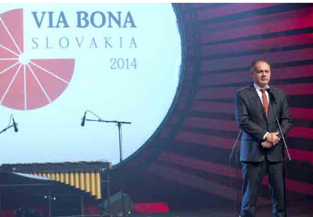
Zodpovednosť v podnikaní podporuje aj prezident Slovenskej republiky Andrej Kiska, ktorý sa osobne zúčastnil odovzdávania cien za rok 2014.

filantropie, darčovstva či zapájanie zamestnancov do dobrovoľníctva.