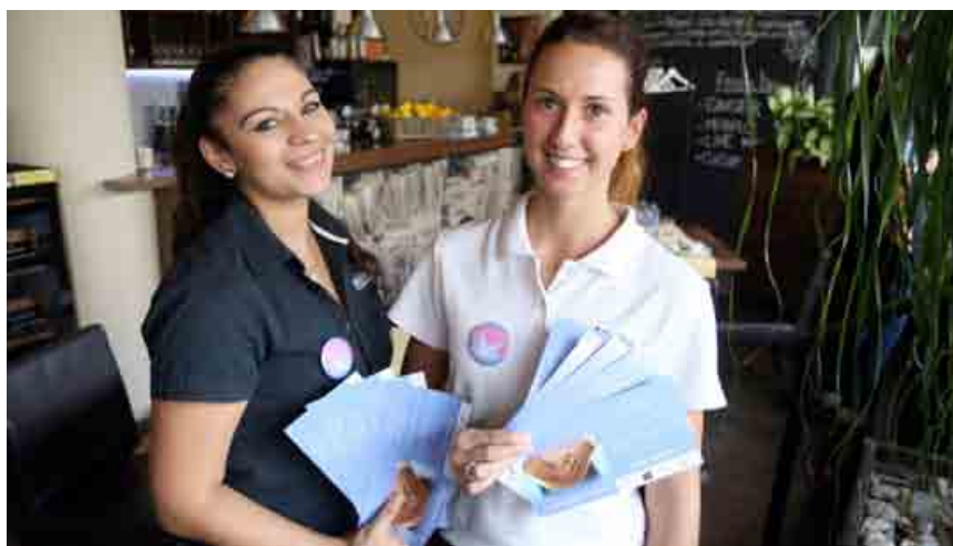
Do projektu sa tento rok zapojilo aj 21 prevádzok, v ktorých obsluhoval personál označený odznakmi a šírili povedomie pomocou informačných letákov o kampani.

Na riziká pitia alkoholu počas tehotenstva už štvrtý rok upozorňuje spoločnosť Pivovary Topvar prostredníctvom obalov svojich produktov. Tento rok