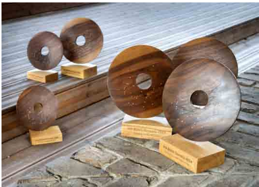
Zašlite nám vašu nomináciu a uchádzajte sa o ocenenie Via Bona Slovakia za rok 2015.