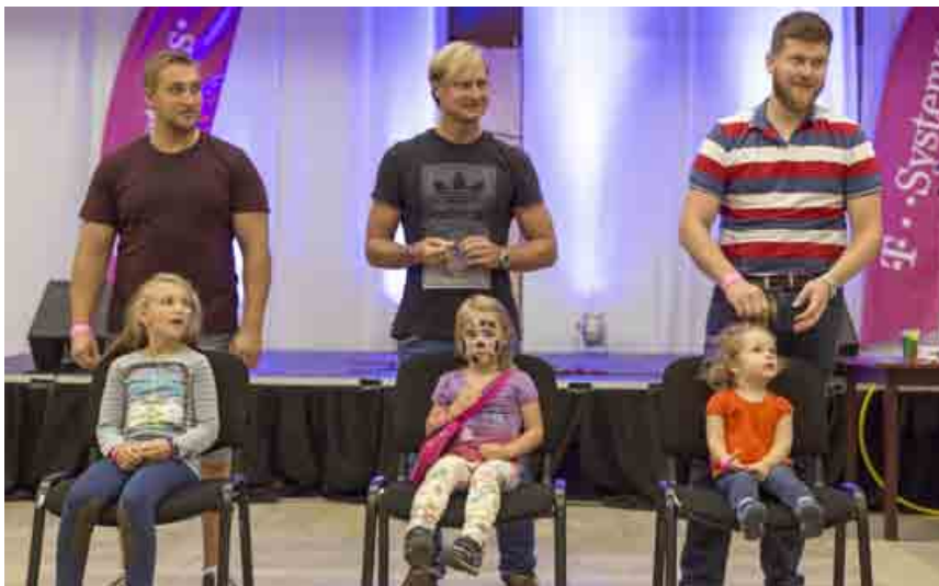
Počas dňa si vyskúšali svoju zručnosť aj oteckovia.

Nechýbal ani pódiový program pre tých, čo práve nesúťažili. Deň detí odštartovala detská diskotéka s mas-